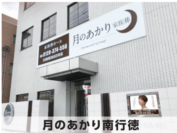
月のあかり南行徳