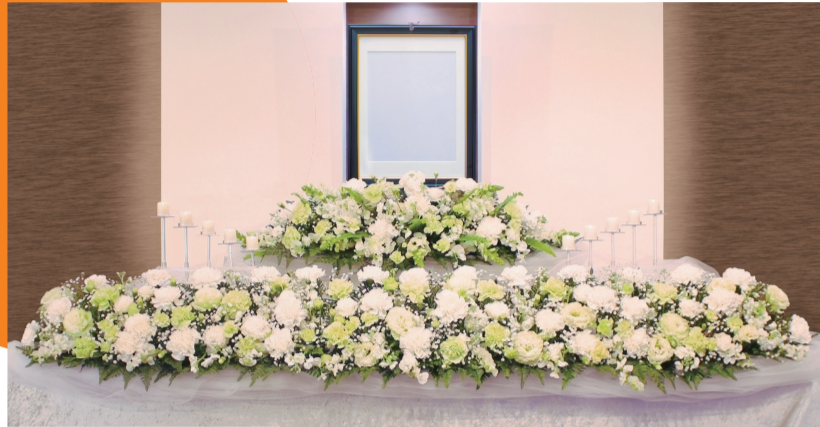
※1日葬45の祭壇イメージ